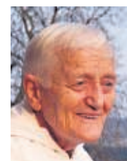
Broeder Roger.

De gemeenschap van Taizé herdenkt dit jaar een aantal bijzondere momenten. Allereerst was het op 12 mei een eeuw geleden dat broeder Roger, de grondlegger van de gemeenschap, in Zwitserland werd geboren. Daarnaast is het dit jaar 75 jaar geleden dat broeder Roger vanwege het uitbreken van de Tweede Wereldoorlog naar Frankrijk trok en op 20 augustus 1940 in het dorpje