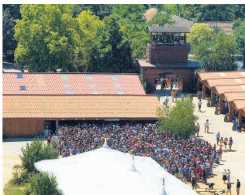
Bezoekers in de rij voor de voedselverdeling.

Aan de zijanten van de zaal staan twee jongens met een mand brood. Naar later blijkt, is dat gewoon brood, bedoeld voor protestanten die moeite hebben met